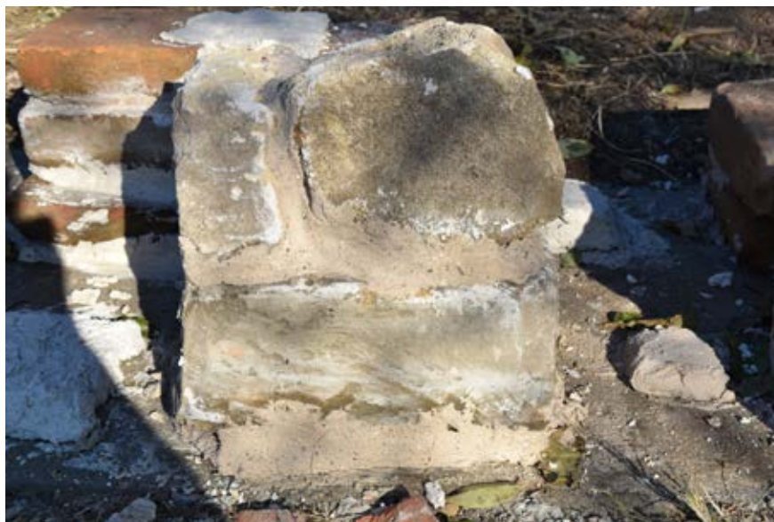
Slika 5 – Modeli maltera na eksperimentalnom zidu, Viminacijum

Njihove karakteristike se i dalje ispituju in situ, pomoću instrumenata mobilne Laboratorije za ispitivanje materijala u kulturnom nasleđu, Tehnološkog fakulteta Novi Sad.