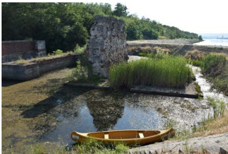
Slika 3 –Trajanov most

JEDAN OD MALTERA IZUZETNIH MEHANIČKIH KARAKTERISTIKA, A ISTOVREMENO MALE SPECIFIČNE TEŽINE, POTIČE IZ OSTATAKA TRAJANOVOG MOSTA U SELU KOSTOL KOD KLADOVA, KOJI JE SAGRAĐEN POČETKOM II VEKA NOVE ERE. TIM PROJEKTA I DALJE RADI NA POTRAZI ZA „TAJNIM SASTOJKOM“ KOJI SU RIMLJANI UPOTREBILI TOKOM ZIDANJA OVOG MOSTA