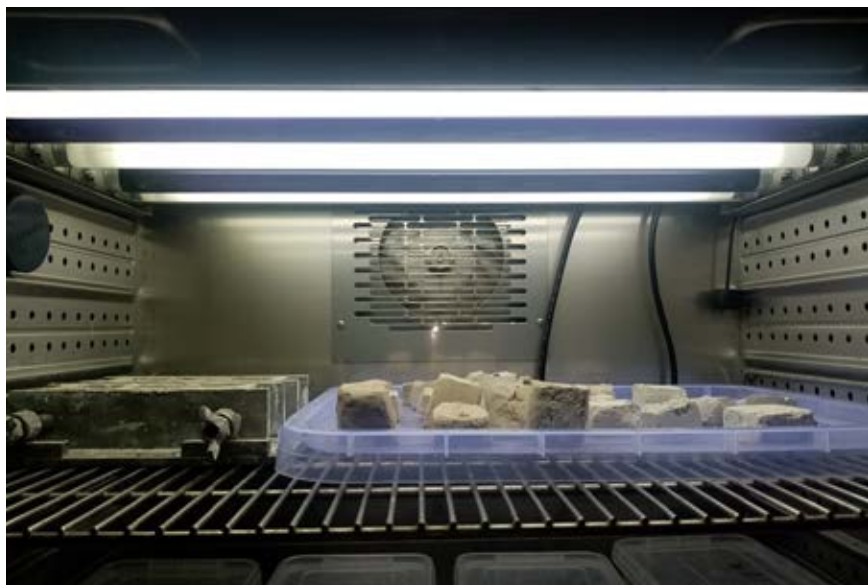
Slika 4 – Modeli maltera u komori za starenje Laboratorije za ispitivanje materijala u kulturnom nasleđu, Tehnološkog fakulteta Novi Sad

Nakon veštačkog starenja, modeli maltera za konzervaciju su ispitani istim metodama kao i originalni uzorci. Oni modeli koji su zadovoljili kriterijume kompatibilnosti su dalje starili u realnim uslovima. Pored ovih laboratorijskih ispitivanja, uzorci koji su najviše obećavali su primenjeni na eksperimentalnim zidanim strukturama, ali na i test površinama autentičnih istorijskih spomenika u realnim uslovima.