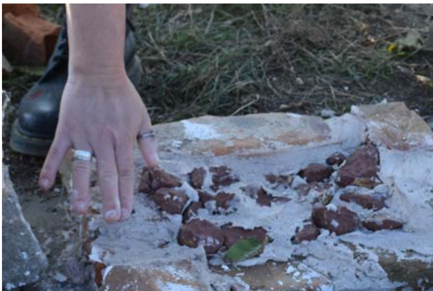
Slika 6 – In situ ispitivanje konzervatorskih maltera – Viminacijum

Ta tradicionalna znanja veštih antičkih graditelja mogu postati inspiracija i oblikovati potragu savremenog čoveka za održivim i neškodljivim zelenim materijalima za moderne poslovne i stambene objekte, kombinujući antičku mudrost sa kapacitetom za inovacije zasnovanom na novim tehnologijama i poslednjim dostignućima nauke.