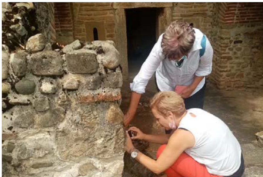
Slika 7 – In situ ispitivanje konzervatorskih maltera grobnica Brestovik

Ovo je od posebnog značaja s obzirom na to da nauka dobija pravi smisao jedino ako je dostupna i primenljiva, a društvo ima koristi od nje. U tom smislu, tim projekta veruje da će otkrivanjem tajni rimskog graditeljstva, posebno uzroka trajnosti i izuzetnih mehaničkih karakteristika pojedinih očuvanih maltera istraživanih spomenika Dunavskog limesa u Srbiji, moći da nam pruži zanimljive uvide u danas zaboravljena istorijska znanja i veštine.