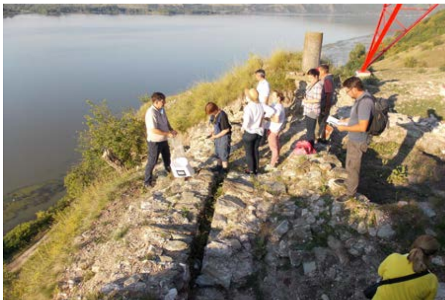
Slika 2 – Uzorkovanje maltera utvrđenja Lederata

Ispitan je sastav kompaktnih uzoraka (Raman spektroskopija, FTIR, XRD i XRF analize), izvršeno je hemijsko odvajanje veziva i agregata uz ispitivanje njihovog sastava, urađene su mineraloško-petrografske analize uzorkovanog materijala, mikroskopska ispitivanja (optička i elektronska mikroskopija), kao i ispitivanja fizičko-mehaničkih karakteristika upotrebom više metoda.